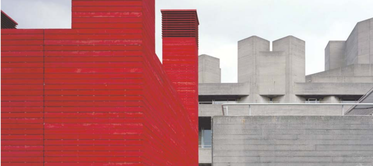
Il. 2. The Shed